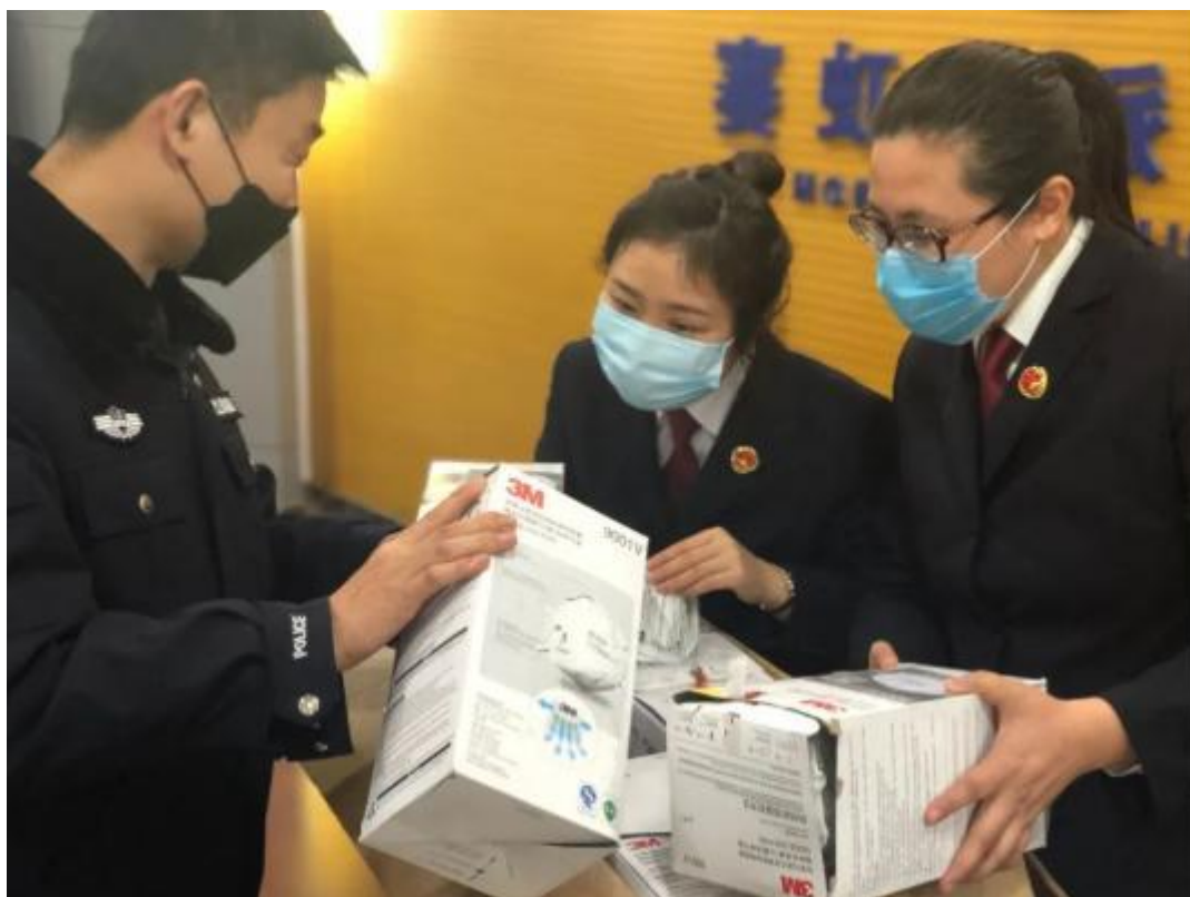
检察官提前介入案件，就侦查取证提出合理建议。