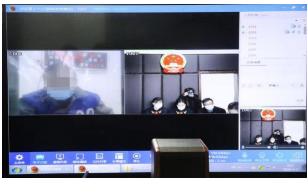
3月2日，案件通过远程视频系统开庭审理。