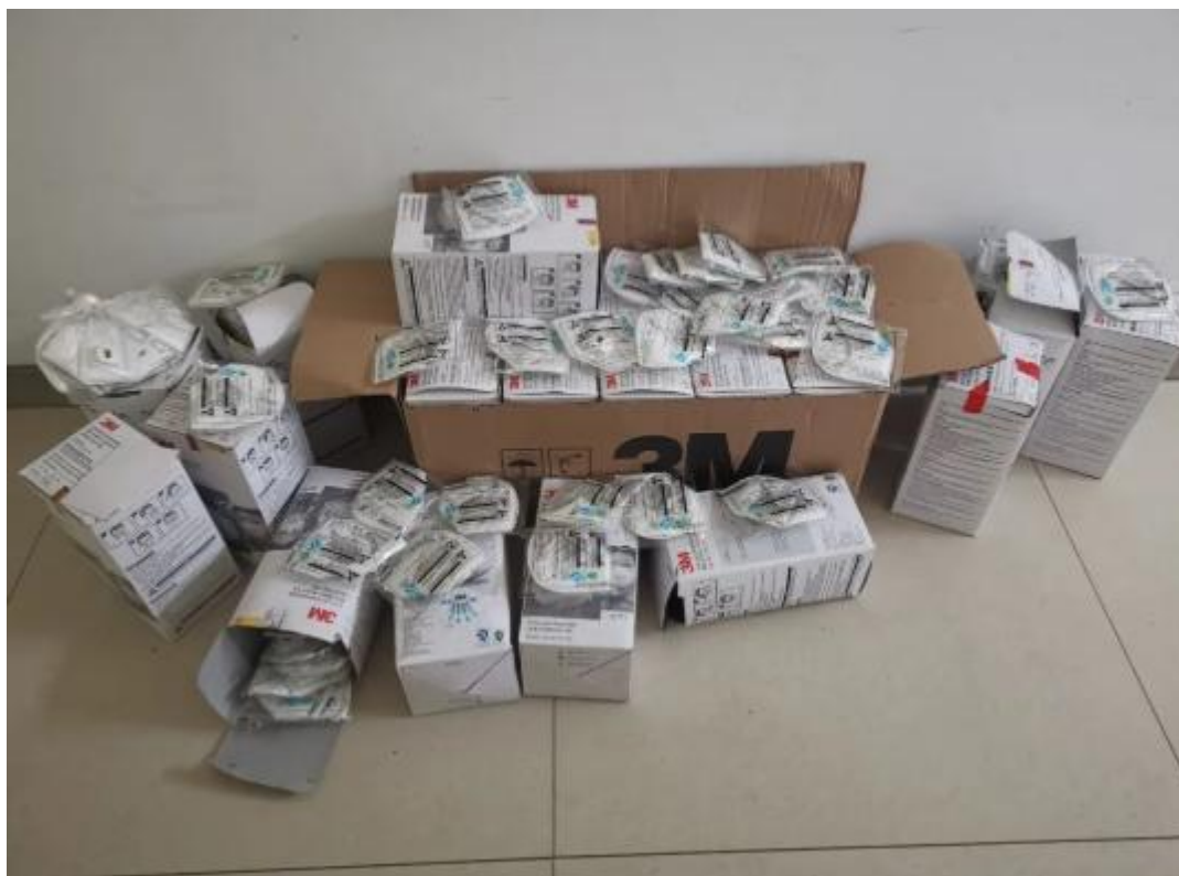
涉案假冒伪劣“3M”口罩。